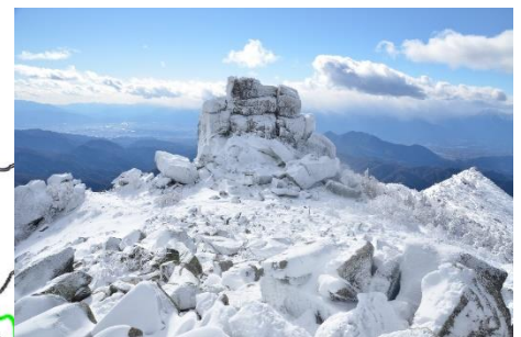
蔵王権現をまつる 金峰山山頂の五丈岩