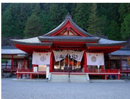
金峰山信仰 (御嶽信仰) の中心神社金櫻神社